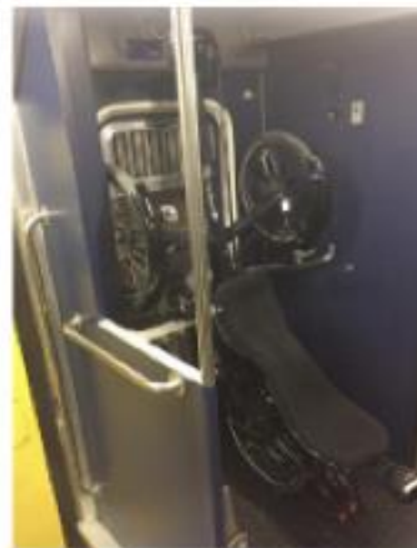
InterRegio, wagon type 3