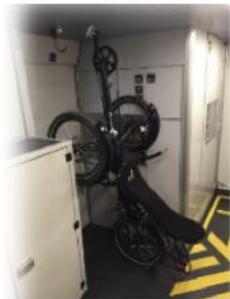
InterRegio, wagon type 1