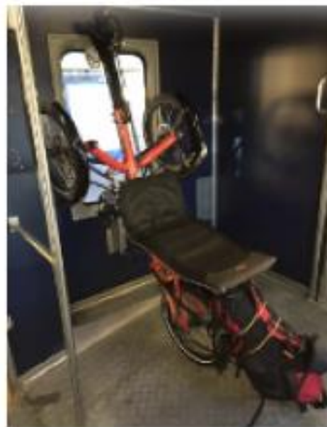
InterRegio, wagon type 2