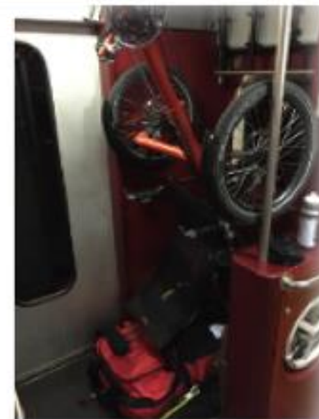
InterRegio, wagon type 4