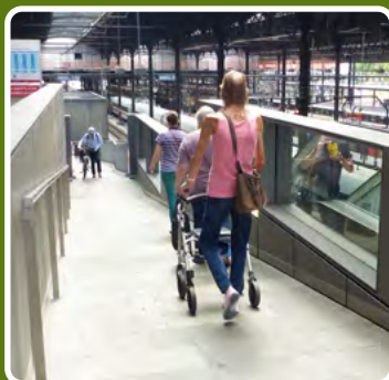
La rampe idéale aussi pour les autres usagers. Une goulotte assez large évite de coincer guidon et sacoches dans la main courante.