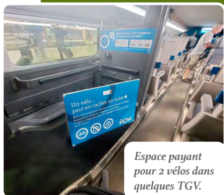
Espace payant pour 2 vélos dans quelques TGV.