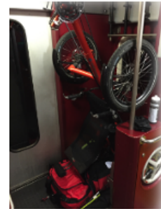
InterRegio, wagon type 4