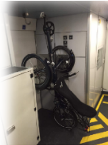
InterRegio, wagon type 1