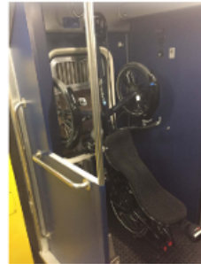
InterRegio, wagon type 3