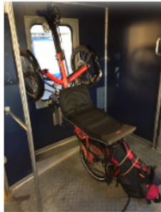
InterRegio, wagon type 2